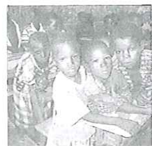
La escuela de Sava acoge a 300 niños, el doble que en 2004.