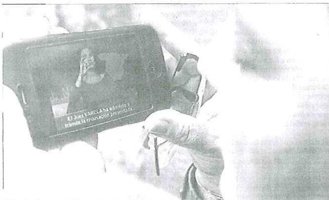
MovISE es un boletín de noticias para el móvil pionero en Europa. J. PARRA

Para dar respuesta a esta necesidad, Catarsis Producciones, una productora que ofrece servicios específicos para personas sordas y ciegas, lanza Noticias MovISE . Se trata de un boletín diario de noticias en lengua de signos que se puede recibir en cualquier móvil con tecnología 3G. Cuesta 30 céntimos, impuestos no incluidos, y puede contratarse en el 795795 o bien a través de Vodafone.